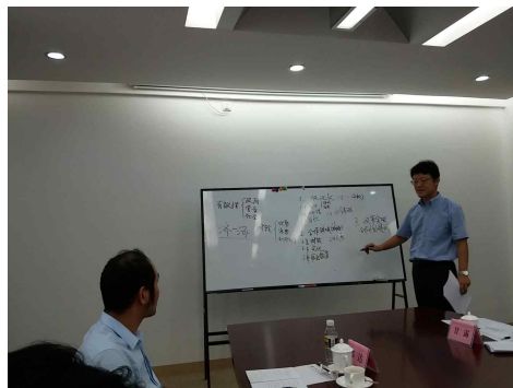
<양 기관의 연구방향 협의>