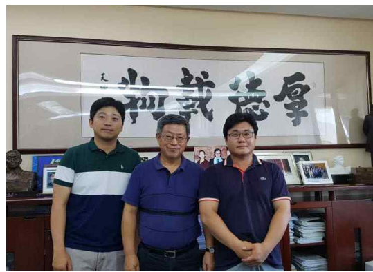
<공동연구 협약 체결>