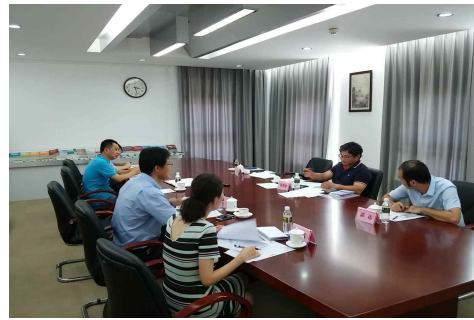
<각 기관(제주)의 연구방향 설명>