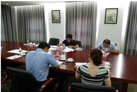
<각 기관(해남)의 연구방향 설명>