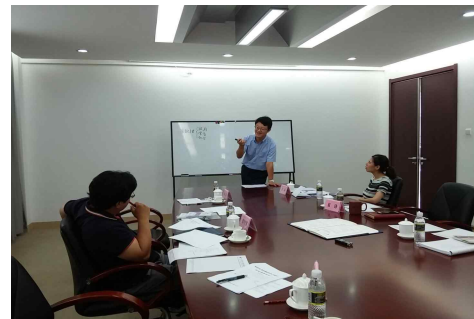
<질의 및 응답>