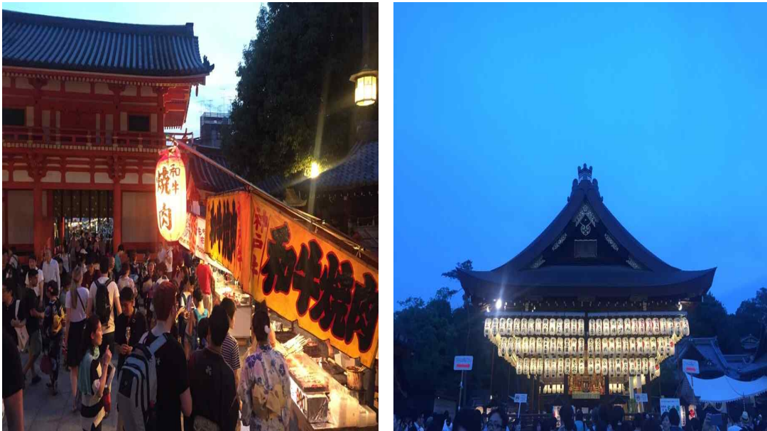
[그림 3] 교토 야간관광 야시장 사례