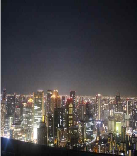
[그림 1] 오사카 야간관광 야경상품 사례