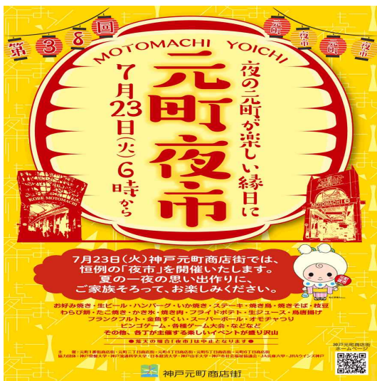
[그림 4] 고베 모토마치상가 야간관광 사례