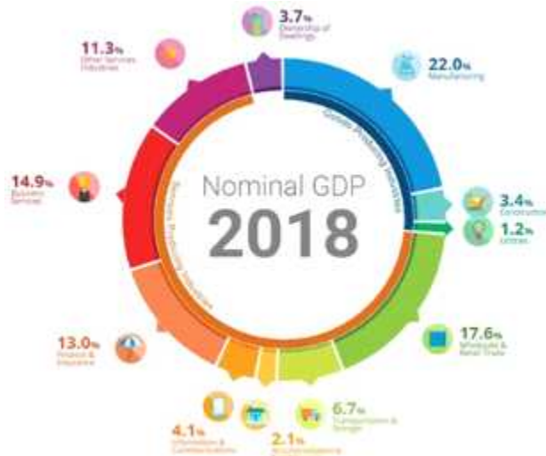
싱가포르 2018년 산업별 국내총생산(GDP) 비중