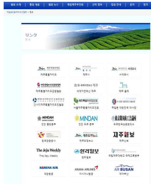
관동제주도민협회 연계 제주도 사이트