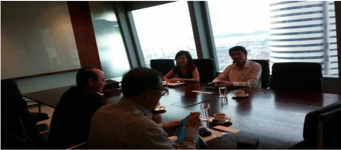
< 싱가포르 투자청 관계자들과의 면담 장면 >