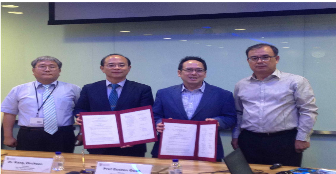
< 양기관간 MOU협약 장면 >