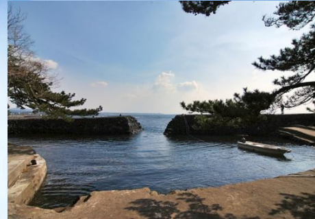
(남원읍 하례리 망장포구)